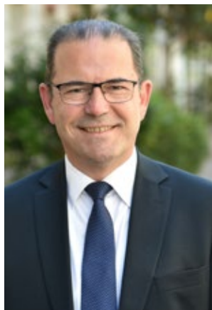
Candidat Conseiller Départemental de Levallois